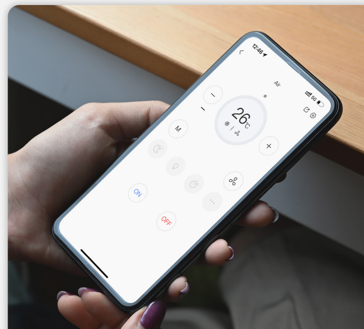
Control a través de la aplicación EZVIZ

Los días de olvidar dónde pusiste tus controles remotos han quedado atrás. Ahora puedes simplemente hablar con los asistentes de voz conectados para dar instrucciones a un dispositivo, o usar tu teléfono inteligente para encender el aire acondicionado incluso antes de llegar a casa del trabajo. También puedes personalizar acciones automatizadas creando escenarios inteligentes o añadiendo horarios programados.