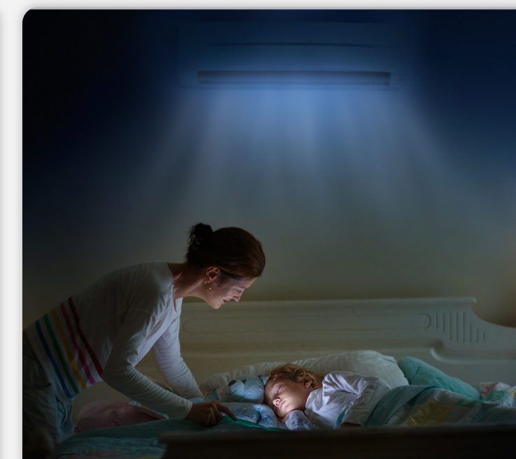
Establecer horarios programa