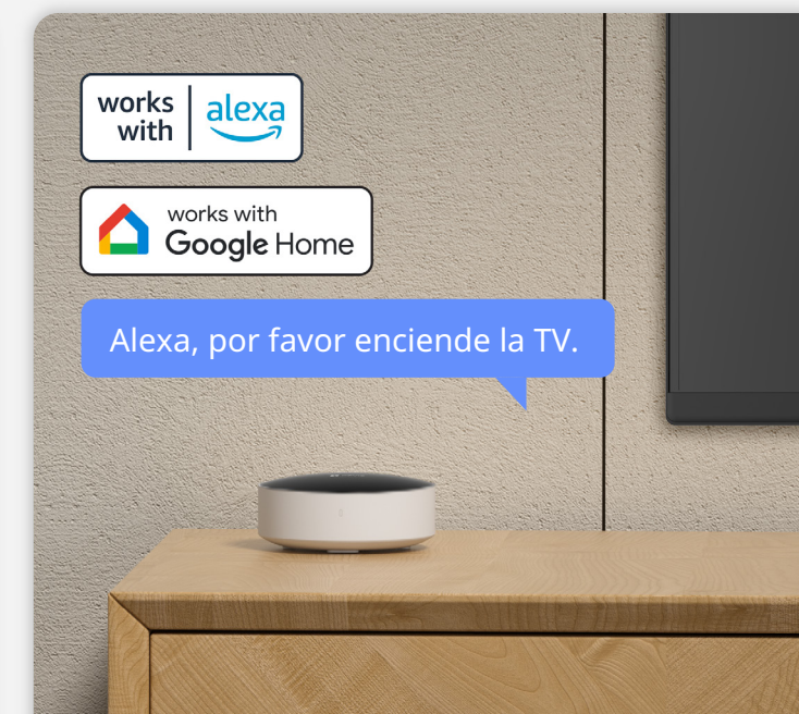
Control con asistentes de voz 3